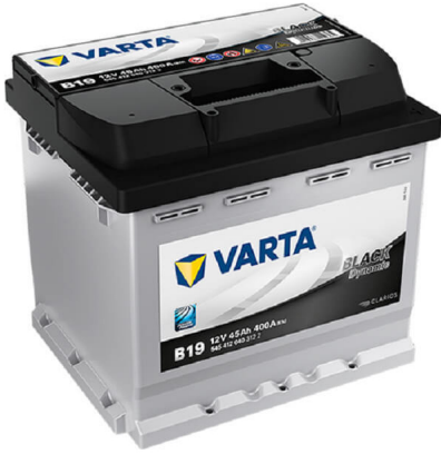
????????? VARTA Black Dynamic B19 12V 45Ah 400EN